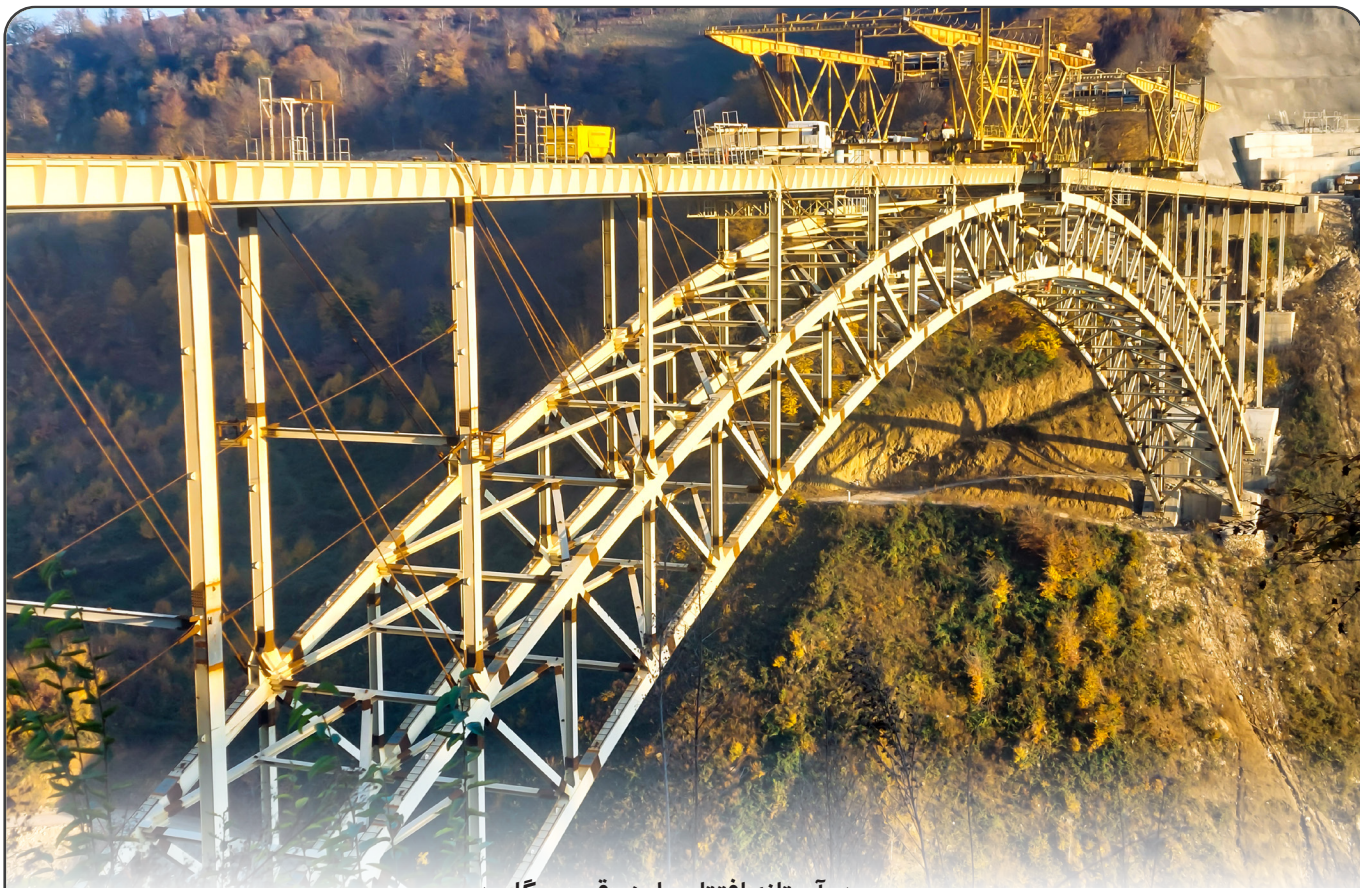
در آستانه افتتاح پل زیرقوسی گلورد

نشریه داخلی شرکت ماشین سازی اراک سال هشتم ● دوره جدید ● شماره ۶ ● آذر ۱۴۰۳