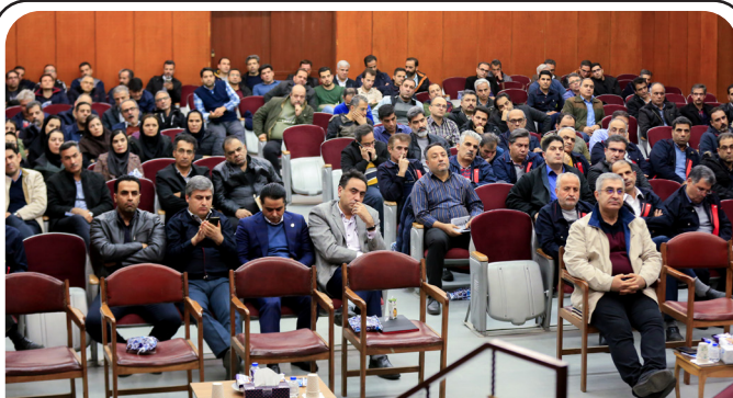
ادامه از صفحه ۲

وی افزود: با توجه به شرایط کنونی شرکت، باید شناخت خود را نسبت به ظرفیت و توانمندی های ماشین سازی اراک مجدداً ارزیابی کرده و نگاهی ویژه به صحنه فعالیت های صنعتی، اقتصادی و رقابتی کشور داشته باشیم. در شرایط تورمی و هزینه های کنونی، شرکت نمی تواند فقط با تولید تجهیزاتی که در گذشته داشته، درآمد لازم را کسب کند و باید به سمت تولید محصولات جدید حرکت کند.