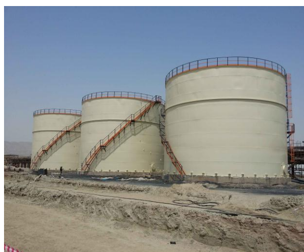
TK-2601A/B/C Carbon Steel A-240-316L