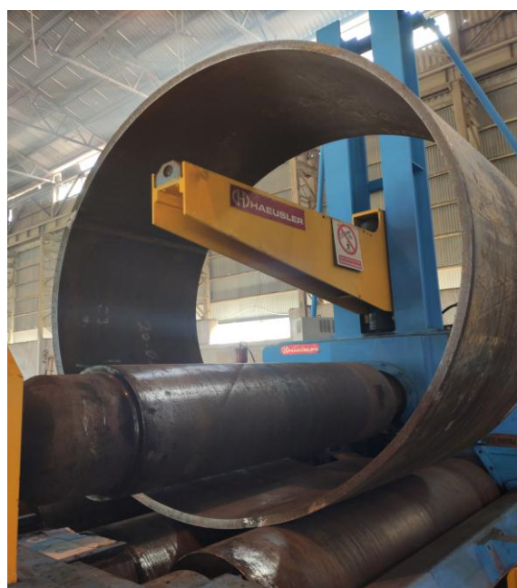
دستگاه رول ورق تا عرض ۲۵۰۰ میلیمتر و ضخامت ۱۵۰ میلیمتر