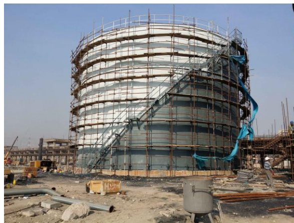
اجرای رنگ آمیزی