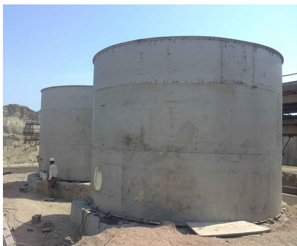
TK-2619 A/B Stainless Steel A-240-316L