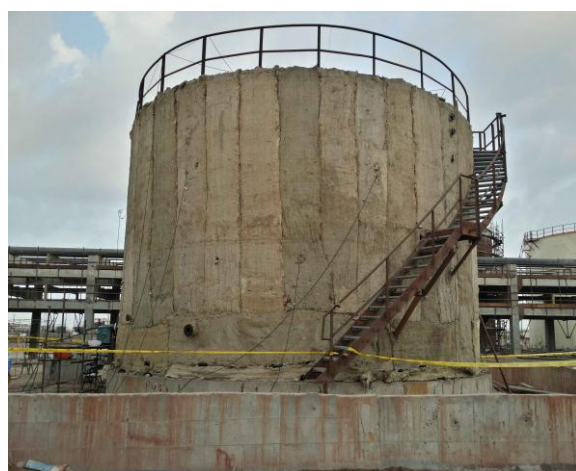
عملیات تنش زدایی