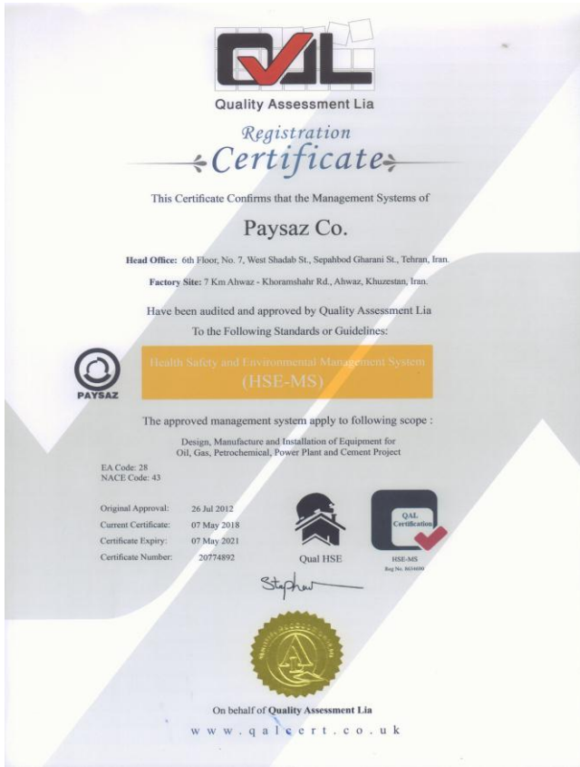
HSE - MS