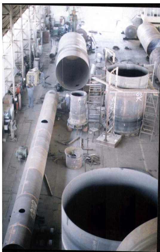
کارگاه ساخت و مونتاژ