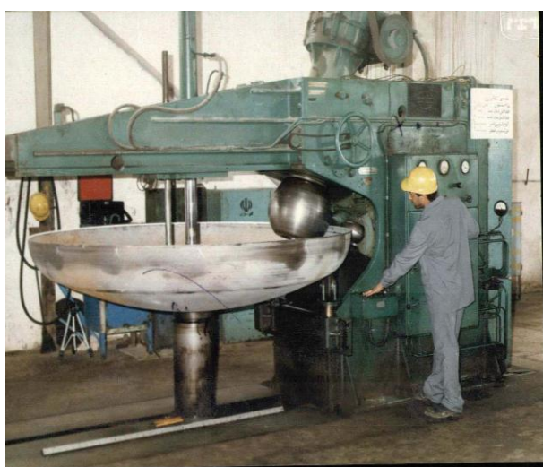
دستگاه عدسی با مشخصات ۳۲۰۰×۱۶